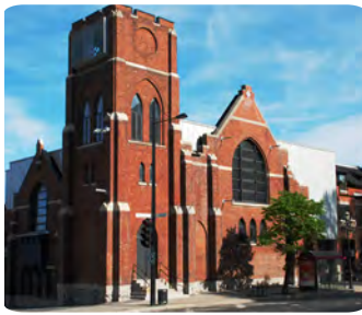
Édifice Jean-Pierre-Perreault