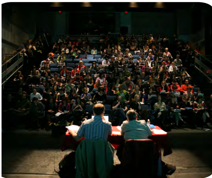
Seconds États généraux de la danse (2009).