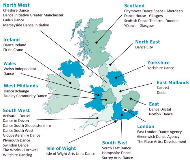
Dance Agencies nationales et régionales

Une faible part de la population va voir des spectacles de danse. Dans les festivals, notamment celui du Dance Umbrella à Londres, la programmation est majoritairement étrangère et non locale. La majorité de la population a une vision négative et critique de la danse et des activités corporelles ; la danse souffre d'une mauvaise image publique. Hors de Londres, dans les régions, les théâtres ne sont pas portés à programmer de la danse.