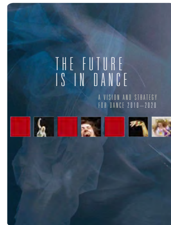
Page couverture du Plan finlandais

finlandaise qui jouit d'une reconnaissance grandissante à l'international. La formation professionnelle, le nombre d'artistes, de compagnies indépendantes ainsi que de festivals et manifestations sont en expansion constante. Le bassin de spectateurs finlandais est estimé à 460 000 au pays, et à 76 000 à l'étranger, pour une moyenne de quelque deux cents créations par année.