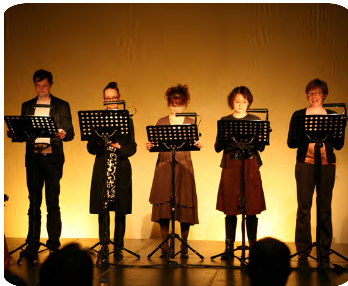
Déclaration d'intentions lors des Seconds États généraux (2009)

taine de propositions issues des États généraux de la danse professionnelle du Québec, fut sans doute notre plus grande pierre d'achoppement. Nous voulions que le Plan directeur permette de bien saisir les réalités et spécificités propres à chaque secteur de pratique, tout en les inscrivant dans un plan d'intervention qui les relie les uns aux autres, tel un grand ensemble plus grand et plus fort que chacune de ses constituantes. La danse est à prendre comme un tout, c'est un écosystème qui, en dépit de sa vitalité apparente, ne dispose pas des leviers nécessaires pour prétendre à un développement durable. Voilà en substance ce que dit notre Plan directeur.