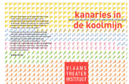
Page couverture du plan directeur "Kanarie in de Koolmijn"

La Fédération belge est composée de trois régions : la Flandre, la Wallonie et Bruxelles. Ce sont la Flandre et Bruxelles qui se sont unis pour élaborer un schéma directeur pour la danse.