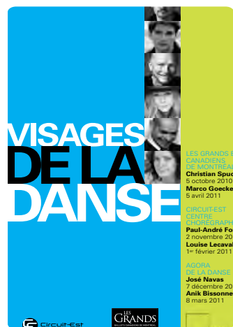
Brochure promotionnelle 2010-2011

Cet état des lieux exhaustif sera suivi d'une seconde étape de consultation du milieu : « Après le dévoilement du Plan directeur de la danse professionnelle au Québec, au printemps, et après l'obtention des résultats de l'état des lieux et des différentes consultations qui en découleront, nous comptons organiser un forum pour la danse dans notre milieu à l'automne 2011. Il nous permettra d'établir un Plan d'action local et de l'ajuster aux directives collectives définies par le Plan québécois, afin de mettre en pratique ses recommandations de façon optimale sur le terrain. » Selon lui, chaque partenaire du milieu de la danse devra adapter les recommandations du futur Plan directeur à sa réalité stratégique locale : « Il ne s'agit surtout pas de suivre une direction propre mais, au contraire, de savoir comment adapter la réalité locale pour s'inscrire au mieux dans les objectifs collectifs du Plan directeur. » Et ce plan local devrait également se donner un horizon de réalisation sur dix ans.