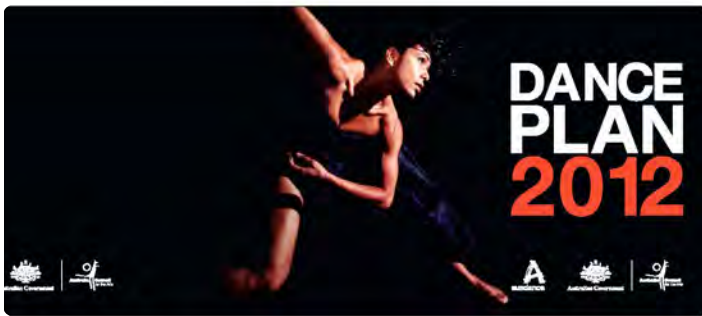
Page couverture du Dance Plan 2012

Le Dance Plan 2012 a été lancé lors du World Dance Alliance, sommet mondial pour la danse qui s'est tenu à Brisbane en juillet 2008. Il est conçu comme un outil de sensibilisation pour l'ensemble de la communauté de la danse mais aussi de la population en général. Rappelant l'urgence d'intervenir, le Plan australien identifie différents contextes dans lesquels la danse peut jouer un rôle de premier plan et être développée : tourisme, diffusion numérique, développement régional, éducation et formation, loisirs et maintien de la santé des personnes âgées et des adolescents. Par ailleurs, le Dance Plan 2012 veut assurer aux artistes que leur formation de haut niveau sera reconnue et valorisée ; que leurs chances de travailler dans le domaine des arts seront multipliées. En ce qui a trait aux artistes aborigènes, il s'agit de les identifier et de les aider à poursuivre un cheminement de carrière durable. Le plan vise à accroître l'accès et la participation à la danse dans tous les secteurs de la société.