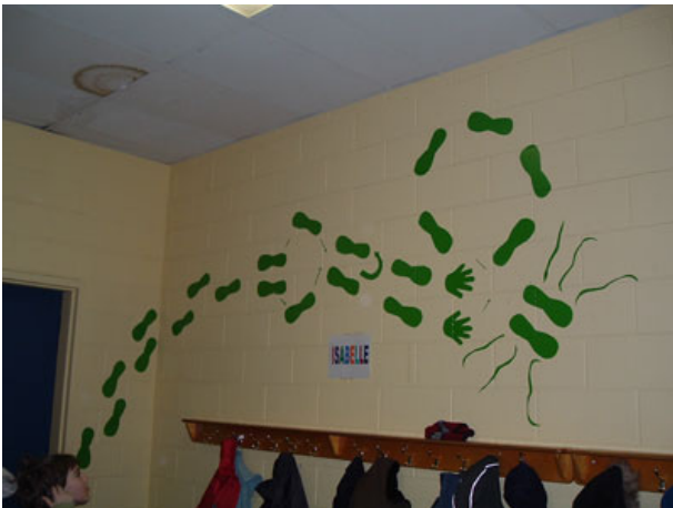
À l'école Laurier, des Traces chorégraphiques ont même fait leur apparition sur les murs intérieurs de l'école !