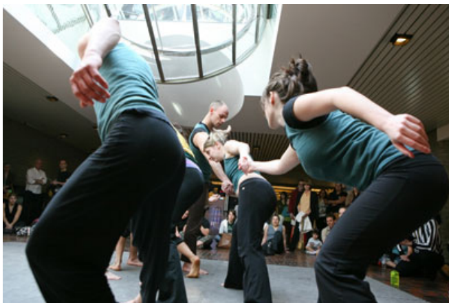
Un match d'impro-mouvements des Imprudanses dans le Hall des pas perdus.