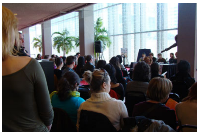
Plus de soixante-quinze personnes étaient présentes à la conférence de presse où était dévoilée la programmation de la quatrième édition de Pas de danse, pas de vie! , le 15 avril 2008 au foyer Jean-Gascon de la Place des Arts.