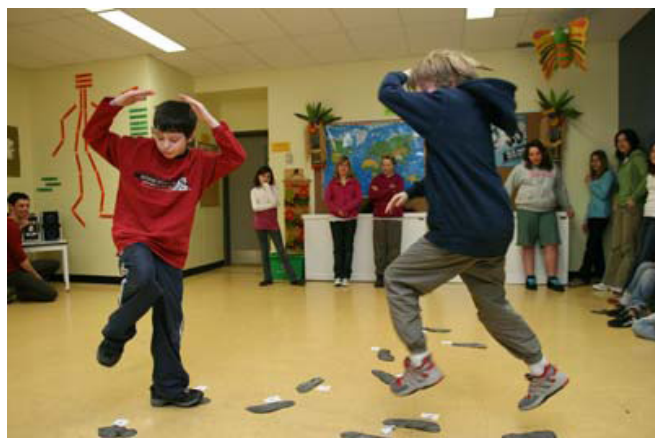
Deux élèves de l'école Lanaudière en duo sur une Trace chorégraphique.