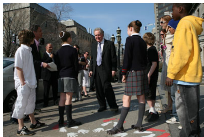
Le premier ministre du Québec, monsieur Jean Charest, participant à l'inauguration de Pas de danse, pas de vie! alors que la Trace chorégraphique de Marie Chouinard était peinte devant ses bureaux à Montréal.