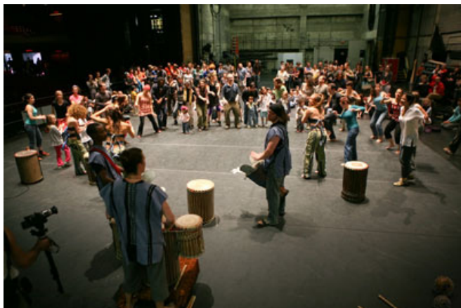
Le public réuni sur la scène du Théâtre Maisonneuve pour danser sur la musique de Taafe Fanga.