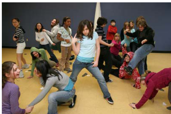
Moment magique capté par le photographe à la fin d'une improvisation.