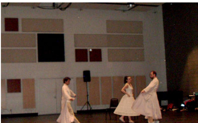
Trois interprètes de la production Barbe Bleue de la chorégraphe Hélène Blackburn avant leur répétition publique à la Place des Arts, le vendredi 25 avril 2008.