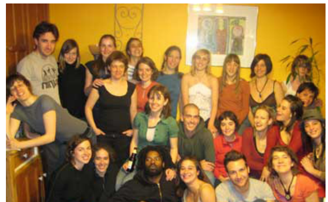
Portrait de l'équipe réunie par La 2e Porte à Gauche pour le projet 7 ½ à part.