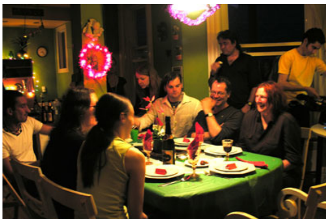
Quelques membres du public attablés pour « le souper de famille » qui concluait la soirée de 7 ½ à part.