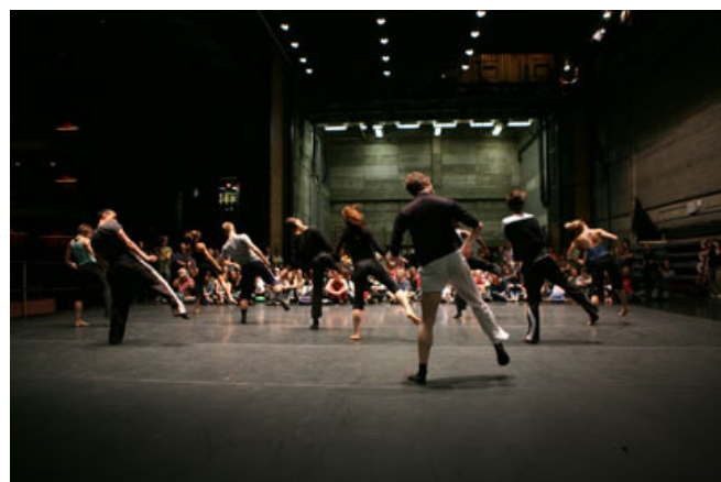
Malgré un spectacle donné la veille, toute l'équipe de [bjm-danse] les Ballets jazz de Montréal était présente pour danser un extrait de la pièce Les Chambres des Jacques, de la chorégraphe Azure Barton.