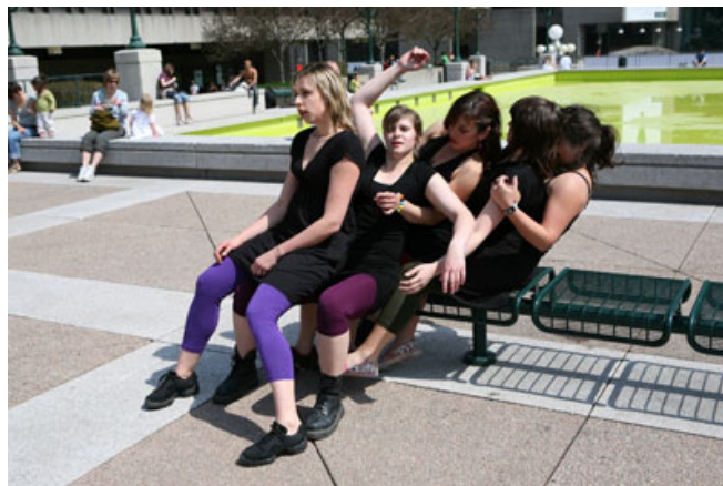
Le collectif Ionic Space en improvisation sur l'esplanade de la Place des Arts.