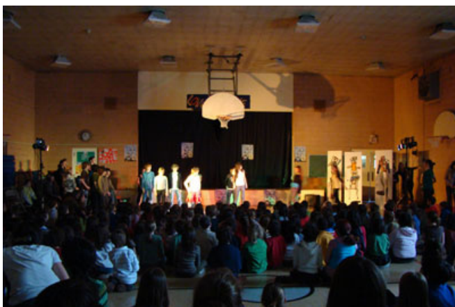
Le 16 avril 2008, tous les élèves et le personnel enseignant de l'école Lanaudière étaient réunis dans le gymnase de l'école pour découvrir les fruits du travail des classes de 5 e et de 6 e année ayant participé au projet de médiation culturelle Traceurs à l'oeuvre.